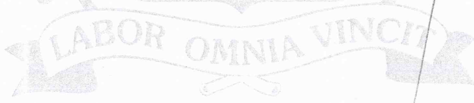
JORGE ABISSAMRA PREFEITO

Ferraz de Vasconcelos, 26 de maio de 2011.